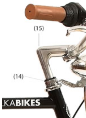
Polka Bagazówka dla Niego