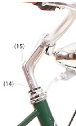
Polka Bagazówka dla Niej